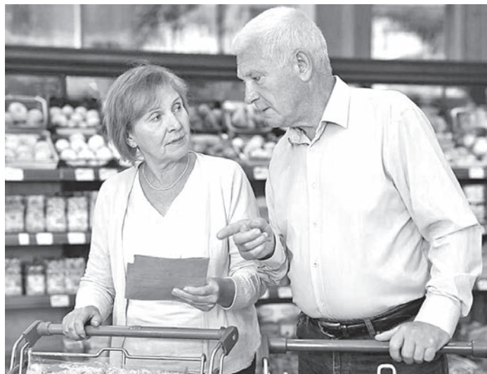
Точный расчет поможет сохранить ваш бюджет.

Получится 12,5 тыс. рублей в месяц по ценам продуктовых магазинов Екатеринбурга. Если взять чуть больше рыбы, орехов, сыра, фруктов, получится около 15 тыс.