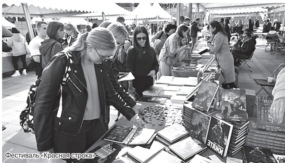
Фестиваль «Красная строка»