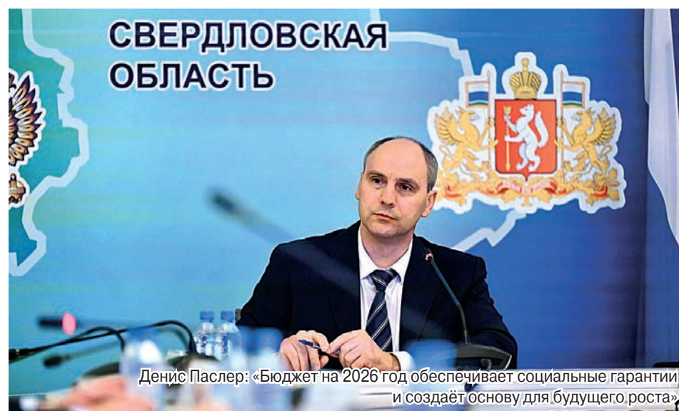
Денис Паслер: «Бюджет на 2026 год обеспечивает социальные гарантии и создаёт основу для будущего роста»

Так, на создание объектов социальной сферы в муниципалитетах региона будет направлено 13,7 миллиарда рублей. В 2026 году будет продолжена работа по строительству и реконструкции объектов ЖКХ, водо- и теплоснабжения на территории муниципальных образований – на эти цели запланировано более двух миллиардов рублей.