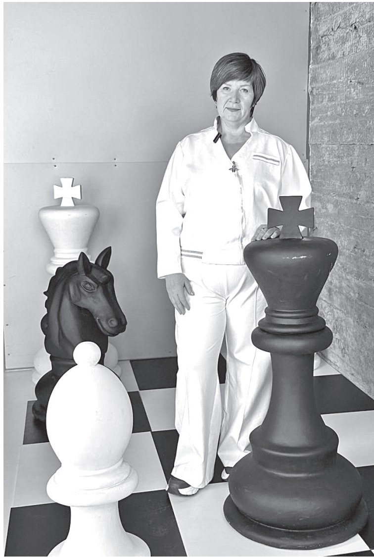
ИНН 66600160598 1. На правах рекламы